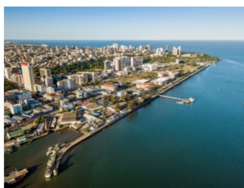
Vista aérea de Maputo, capital de Moçambique

O GT contribui para a agenda de avaliação de Moçambique, dando sequência à Revisão Nacional Voluntária da Agenda 2030 e às reformas do Sistema de Administração Financeira do Estado.