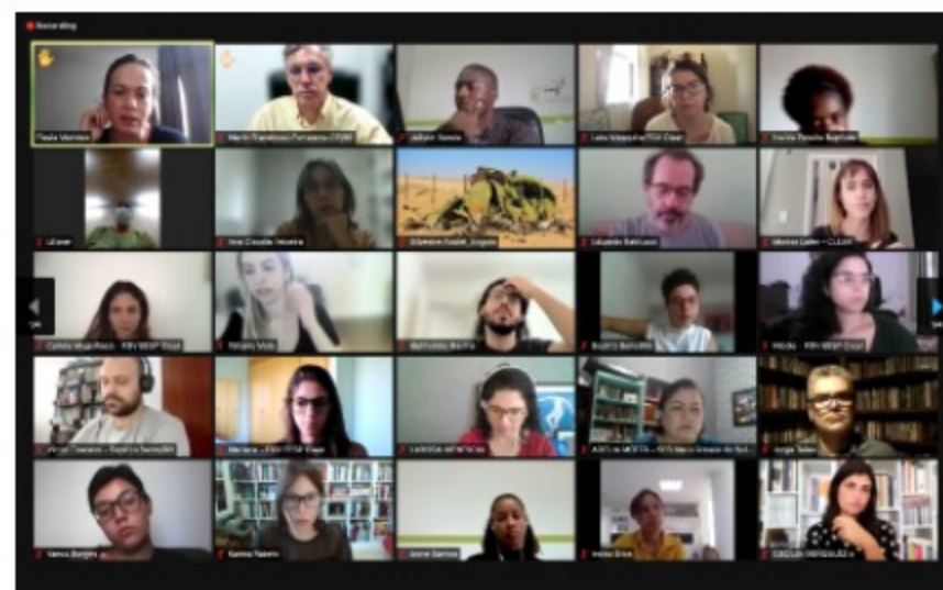
Participantes e equipe do FGV EESP Clear reunidos no primeiro encontro do Curso Online de Avaliação Executiva