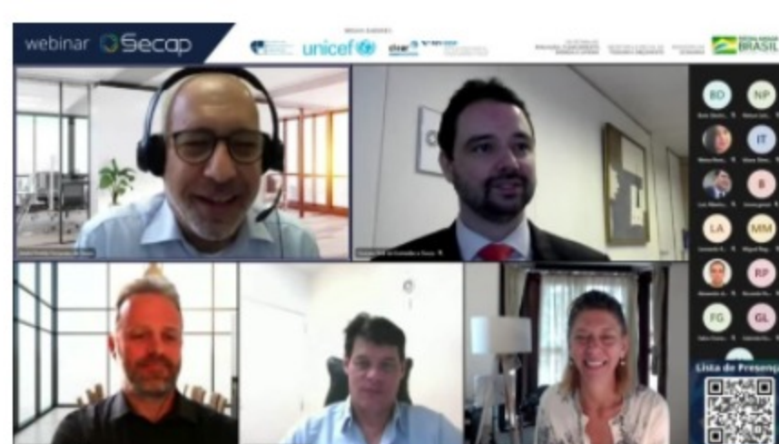
Panel de abertura do webinar "Avaliação de políticas públicas: uma realidade em expansão no Brasil e no mundo"